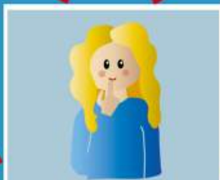
ПРИКОСНОВЕНИЕ К ЛИЦУ, ГЛАЗАМ, НОСУ, РТУ