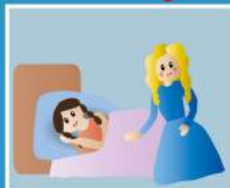
УХОД ЗА БОЛЬНЫМИ