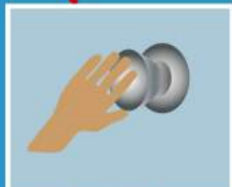
КОНТАКТ С ЗАГРЯЗНЕННЫМИ ПОВЕРХНОСТЯМИ