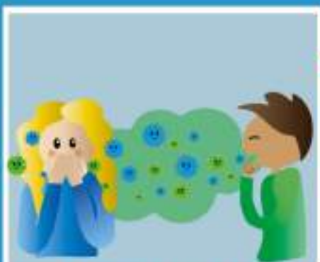
КАШЕЛЬ, ЧИХАНИЕ (ВОЗДУШНО-КАПЕЛЬНЫМ ПУТЕМ)